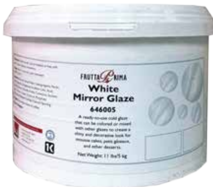
#0812 BRILLO BLANCO