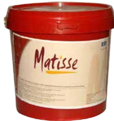
#0333 BRILLO ESPEJO DORADO