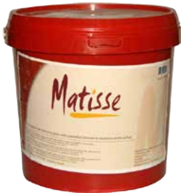
#0334 BRILLO ESPEJO PLATEADO

HAGA BRILLAR SUS CREACIONES COMO NUNCA ANTES CON EL NUEVO “GLASEADO ESPEJO RESPLANDOR. ESTE PRODUCTO INNOVADOR DA A SUS CREACIONES Y POSTRES DE CHOCOLATE UN PERFECTO BRILLO Y TERMINADO HACIENDO QUE SUS POSTRES VERDADERAMENTE BRILLEN.