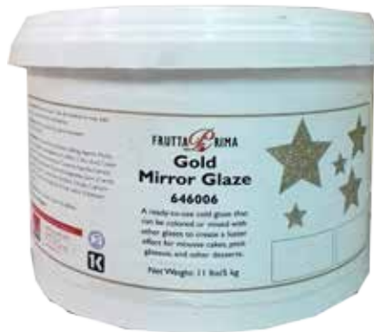
#0813 BRILLO DORADO