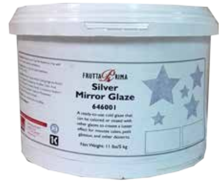
#0792 BRILLO PLATEADO